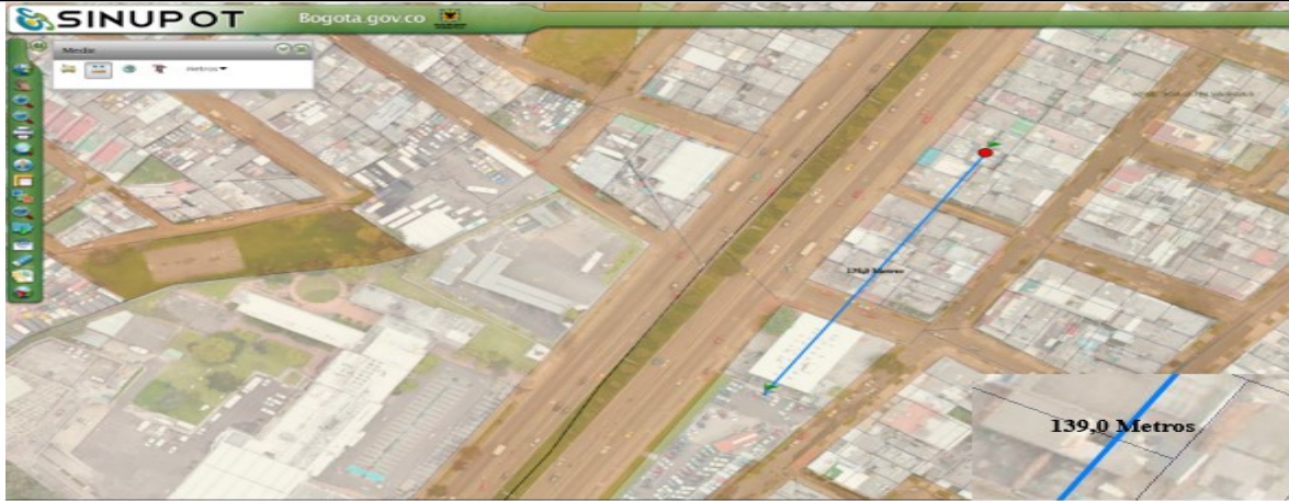
Figura 3. Distancia calculada entre vallas, 139 metros

2. La evaluación urbanística del Concepto Técnico 05949 del 26/08/2013 emitido para la solicitud de primera prórroga, a su vez corroboró, que entre los elementos existe una distancia de 138.30 metros aproximadamente; de acuerdo con la visita técnica realizada el día 07/12/2012, esta medición se realizó en el sitio y se utilizó el instrumento denominado odómetro, el cual calcula la distancia total o parcial entre dos puntos de referencia. (Ver figura 4).